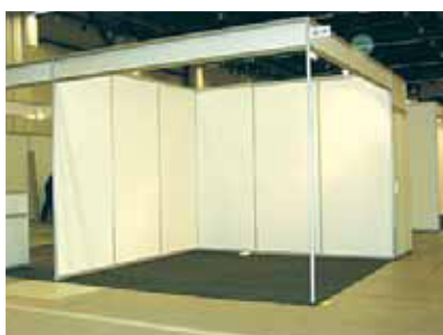
Pakettiosasto rakennetaan varatulle paikalle valmiiksi.